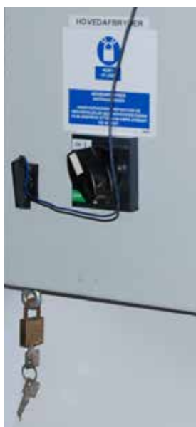
Hængelåsen er tilgængelig i nærheden af hovedafbryder.

Der må IKKE være en reparationsafbryder mellem styreskab og motor, når motorerne er mekanisk forbundet, dvs. at vertikalsneglen kan drives af to forskellige motorer. Det vil give en falsk tryghed. Slukkes der fx kun for blandemotoren, kan tømme-motoren starte, da anlægget er automatisk, og de to motorer kan køre uafhængigt af hinanden. Kun hovedafbryderen slukker for hele anlægget.